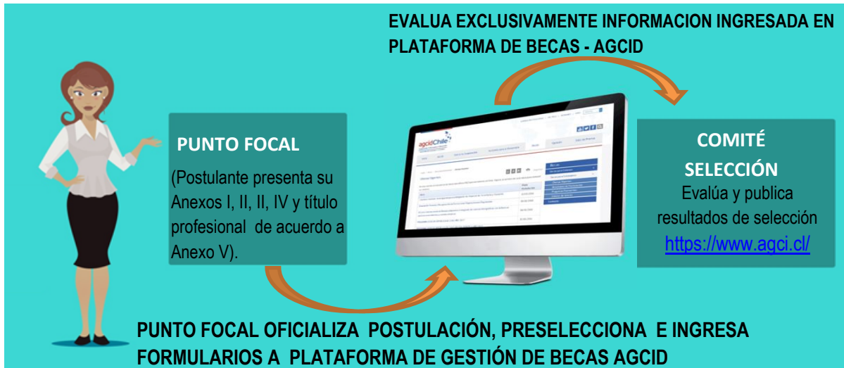
Figura 1: Procedimiento de Postulación

Los/las candidatos/as deben presentar la siguiente documentación: